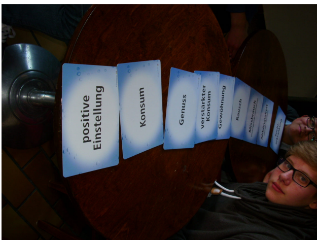
Ein möglicher Suchtverlauf von der positiven Einstellung bis zur Suchterkrankung .