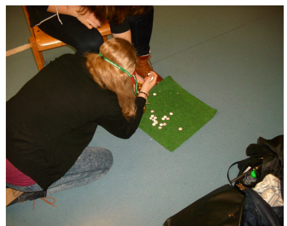
feinmotorische Handicaps mit der Rauschbrille