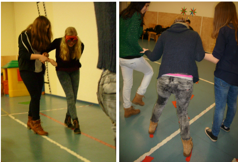
Gleichgewichts- & Orientierungsprobleme mit der Rauschbrille